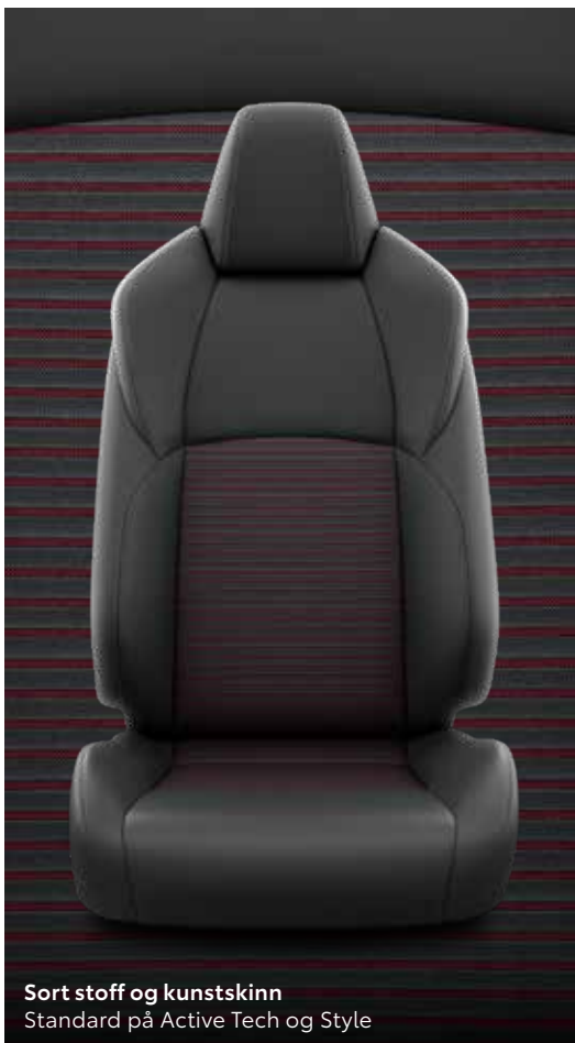
Sort stoff og kunstskinn Standard på Active Tech og Style