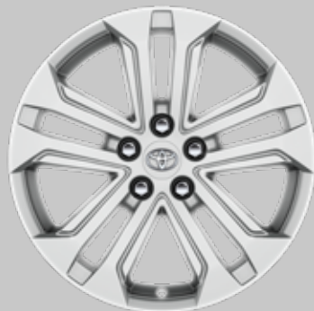
18" sølvfargede aluminiumfelger med 5-doble eiker Tilleggsutstyr alle grader