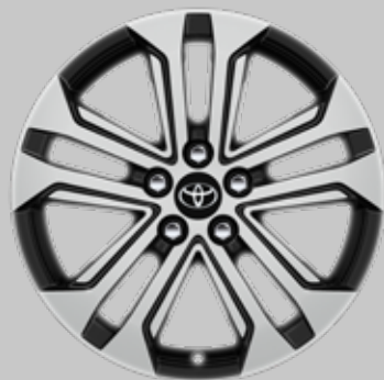
18" aluminiumfelger med maskinert overflate og 5-doble eiker Tilleggsutstyr alle grader