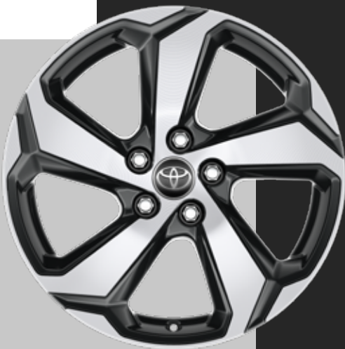
18" grå aluminiumfelger med maskinert overflate (5 eiker) 225/60R18 Standard på Life, Active og Active Tech

Avhengig av utstyrsgrad må du velge hvilke av de iøynefallende aluminiumfelgene på 18" eller 19" du ønsker på din RAV4 Plug-in Hybrid. Inne i kupéen får du et sort interiør i valg mellom en rekke forskjellige materialer fra kunstskinn til ekte skinn med røde kontrastsømmer som gir et sportslig preg.