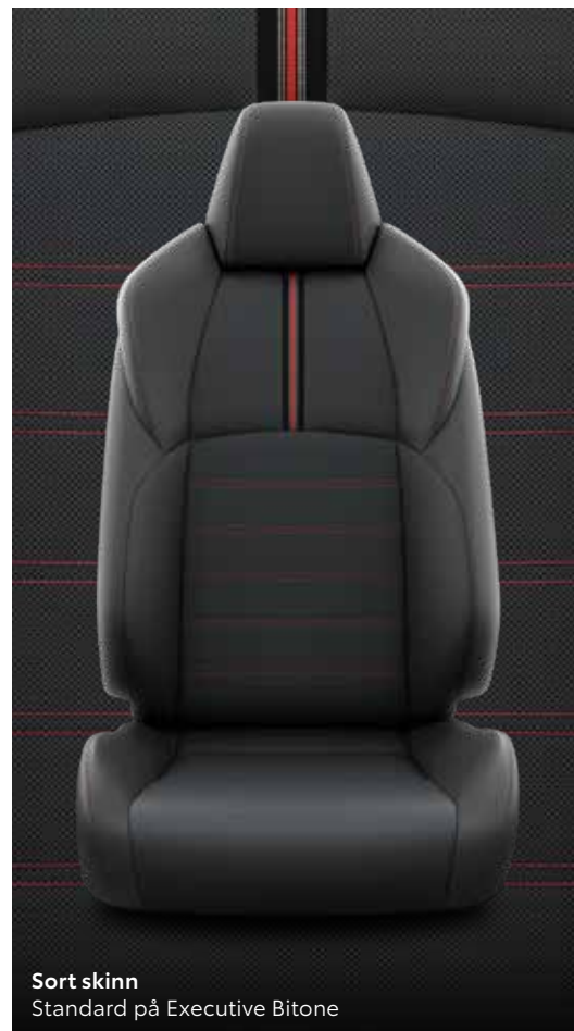
Sort skinn Standard på Executive Bitone