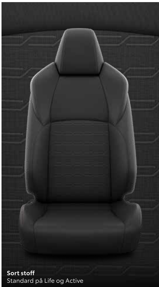
Sort stoff Standard på Life og Active