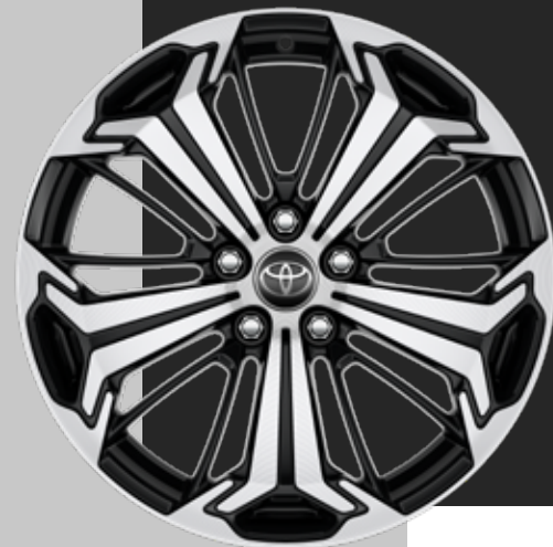
19" sorte aluminiumfelger med maskinert overflate (5 eiker) 235/55R19 Standard på Style og Executive Bitone