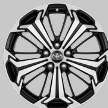
19" aluminiumfelger i sort med maskinert overflate, 5-eiker Y-design Tilleggsutstyr alle grader